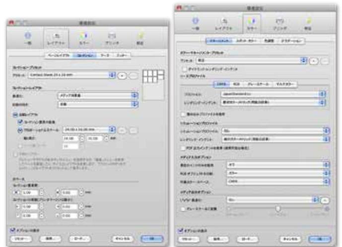
多彩な設定項目により、様々な用途でご利用いただけます。

最新の ICC に準拠した EFI Fiery eXpress は各社のインクジェットプリンタで色評価用プリントを実現。RGB 画像を直接 CMYK 標準色でプリントするシミュレーションも可能です。色認証用のカラーチャート、ジョブチケットや EXIF データの欄外プリントなどが可能で、グラフィックアーツやプロフォト、印刷の仕事に携わる多くのユーザーにご利用いただけます。