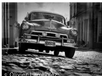
フィルム : Fuji Neopan 100 + フレーム #4+ クリエイティブヴィネット