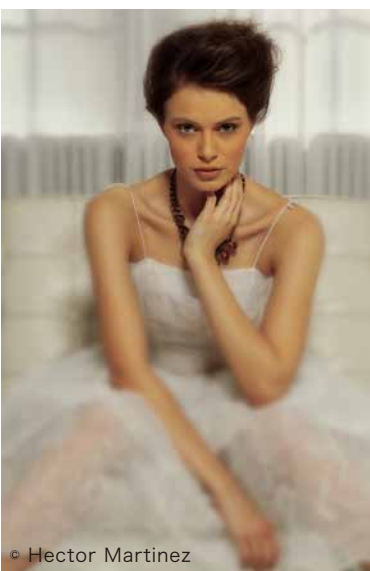
フィルム : Lomography + クリエイティブブラーヴィネット